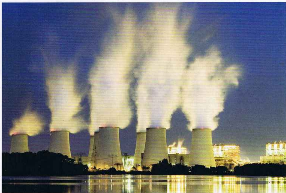
Bald „sauber“? Vattenfalls Braunkohlekraftwerk in Jämschwalde stößt jährlich 25 Mio. Tonnen CO 2 aus.

Wussten Sie, dass die CO 2 -Abscheidetechnik per Gerichtsbeschluss nicht als „CO 2 -frei“ bezeichnet werden darf? Das CO 2 kann nämlich gar nicht vollständig abgeschieden werden, und es entweichen noch erhebliche Mengen in die Atmosphäre.