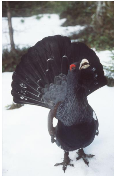
Ein balzender Auerhuhn

Ökonomisch zahlt sich die Einrichtung eines Nationalparks somit im Wesentlichen in den angrenzenden Naturparkgemeinden aus, da im Nationalpark selbst keine Hotels und Restaurants entstehen werden. Die Bedeutung der viel größeren Naturparkregion steigt mit einem weltweit bekannten Premium-Prädikat „Nationalpark“ und verleiht dem gesamten Nordschwarzwald ein renommiertes Alleinstellungsmerkmal. Im Doppel wirken Nationalpark und Naturpark besonders erfolgreich – das zeigen Beispiele in anderen Bundesländern 10 .