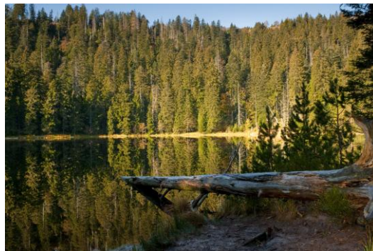
Der Wilde See im gleichnamigen Bannwald

In einem Nationalpark wird bewusst auf die Nutzung von Holz verzichtet, da die ungestörte natürliche Entwicklung Arten neuen Lebensraum eröffnet, der im Wirtschaftswald nicht mehr besteht. Der jährliche Ausfall an Nutzholz im Schwarzwald wäre mit vmtl. 30.000 bis 50.000 Festmeter vergleichsweise gering und entspricht in etwa dem Holzdurchsatz eines mittleren Sägewerks im Schwarzwald in 2 Monaten oder 0,5% des jährlichen Gesamtein-schlags im Land. All das wird den Holzmarkt in Baden-Württemberg mengenmäßig oder durch höhere Holzpreise nicht sonderlich beeinflussen.