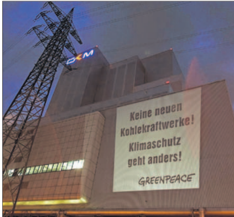
Bereits am Mittwochabend projizierte Greenpeace seine Forderung an die Front des Großkraftwerks, wo ein neuer Block entstehen soll.