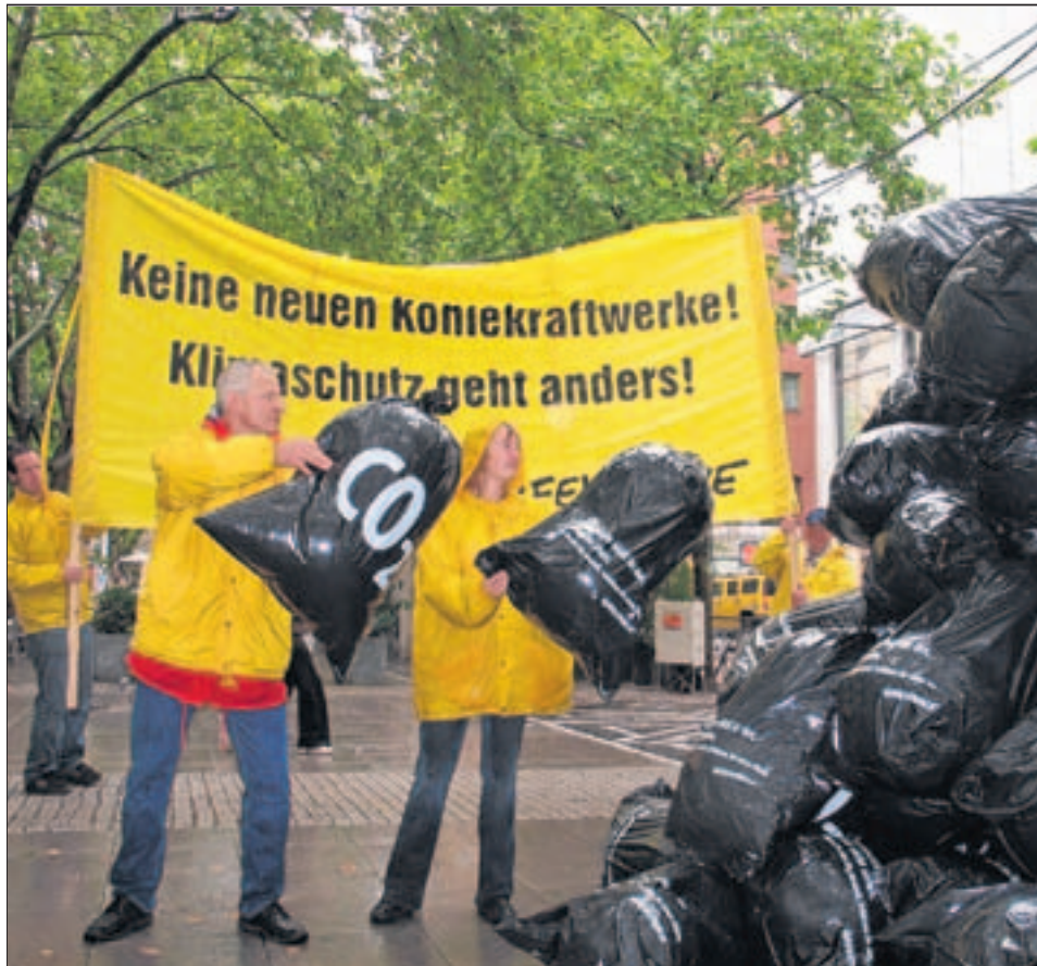
„Keine neuen Kohlekraftwerke“ lautet die zentrale Forderung von Greenpeace. Bei einer Aktion auf den Kapuzinerplanken veranschaulichten die Aktivisten den CO 2 -Ausstoß.