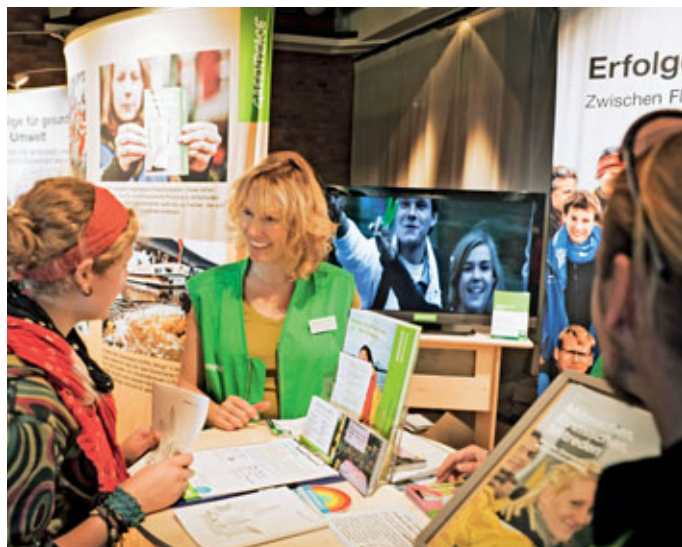
Berlin, 9. Oktober 2010, die letzte von sieben Stationen der Greenpeace-Deutschlandtour zum 30. Geburtstag. Die Gruppen vor Ort sind mit Begeisterung dabei und führen viele Fachgespräche mit Besuchern.

Im Internet, unter http://gruppen.greenpeace.de , gibt es diese Karte in interaktiver Form. Wenn Sie auf einen Ort klicken, kommen Sie direkt zur eigenen Homepage der dort aktiven Greenpeace-Gruppe – und finden so die gewünschten Kontaktdaten und Ansprechpartner. Alternativ (oder im Fall weniger Gruppen, die keine eigene Homepage betreiben) können Sie die Kontaktdaten bei der Greenpeace-Telefonzentrale in Hamburg erfragen. Telefon: 040/306 18-0