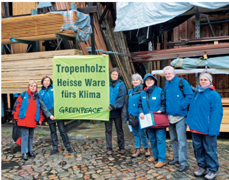
Anklage: Mordhorst. Greenpeace findet heraus, dass der Hamburger Holzhändler Mordhorst KG Tropenhölzer aus Urwaldzerstörung verkauft. Ein Fall für die Team50plus-Gruppe aus Hamburg.

ein gutes Beispiel für die Methode „Global denken, lokal handeln“ – schließlich geht es um den Klimaschutz, ein weltumspannendes Thema.