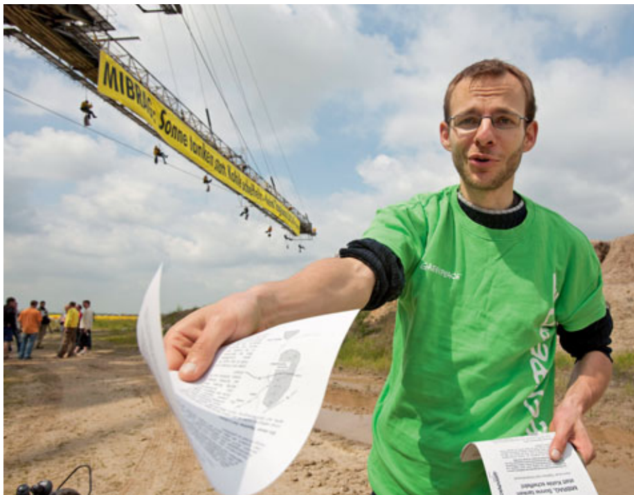
Mitmachen ist die Devise: Die Gruppe Leipzig macht sich gegen neue Braunkohletagebaue der MIBRAG im Raum Lützen/Sachsen-Anhalt stark. Im Mai 2010 protestieren einige Aktivisten auf einem ehemaligen Absetzbagger der MIBRAG, andere informieren die Presse und Passanten.