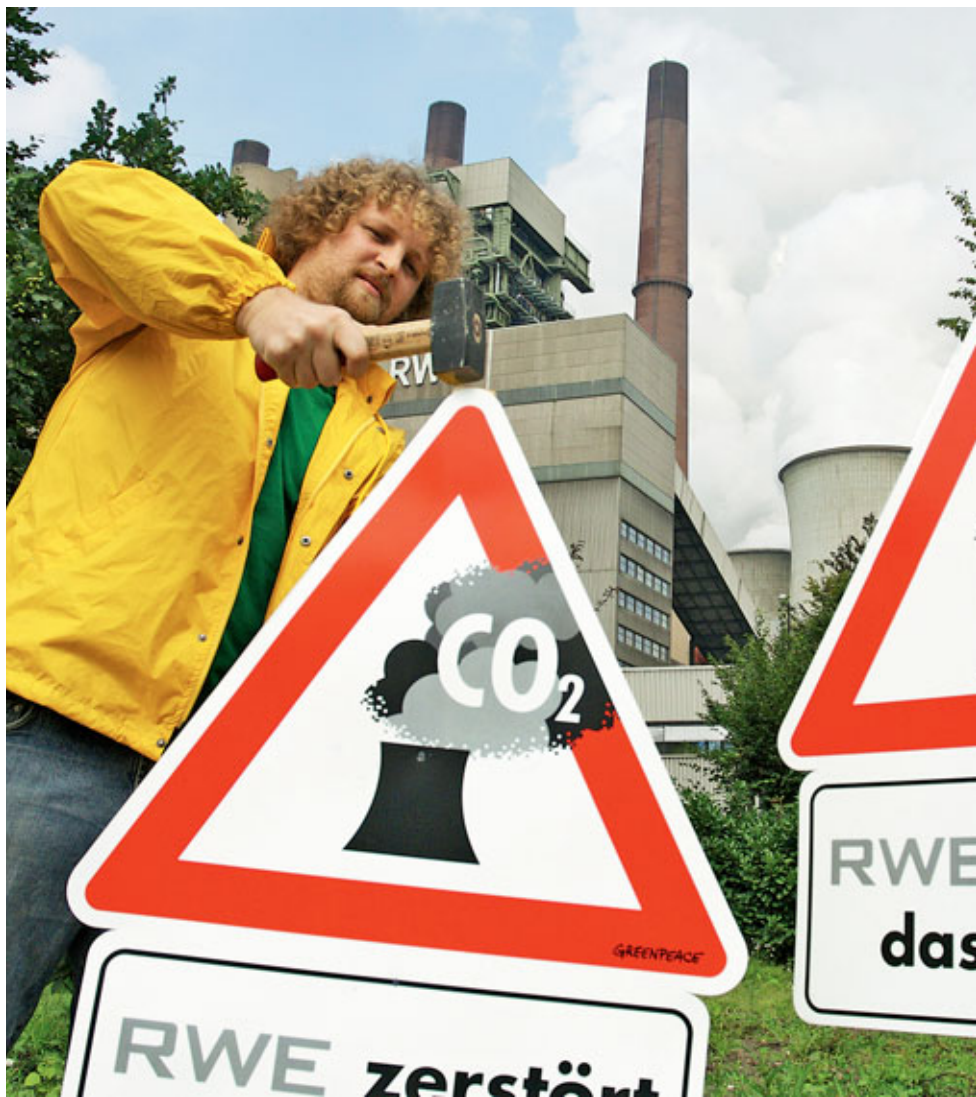
Warnung vor neuem Klimakiller: Im August 2006 begleiteten Greenpeace die Grundsteinlegung für ein Braunkohlekraftwerk der RWE in Neurath, bei der auch Kanzlerin Angela Merkel anwesend ist. Greenpeace fordert von der Regierung, keine neuen Braunkohlekraftwerke zuzulassen.

Ein wichtiger Teil der Arbeit ist die Teilnahme an bundesweiten und internationalen Kampagnen von Greenpeace, zum Beispiel für Meeresschutzgebiete oder gegen die Atomkraft. Auch organisieren die Ehrenamtlichen eigene regionale Kampagnen oder Projekte, etwa zum Schutz des Klimas oder der Wälder. Die Vorhaben werden mit der Hamburger Zentrale inhaltlich abgestimmt und finanziell kalkuliert.