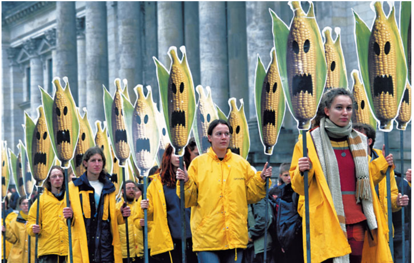
Dem Gegner eine hässliche Fratze zeigen: Greenpeace-Ehrenamtliche protestieren im Oktober 2003 in Berlin gegen den Anbau genmanipulierter Pflanzen, spicken den Rasen zwischen Reichstag und Kanzleramt mit stilisierten Maiskolben à la Halloween.

Greenpeace Deutschland hat mit spektakulären Aktionen und beharrlicher Arbeit in 30 Jahren viele Erfolge für die Umwelt errungen. Was Greenpeace stark macht, ist die Zusammenarbeit von Haupt- und Ehrenamtlichen. Alle ziehen an einem Strang, um globale Umweltziele zu erreichen.