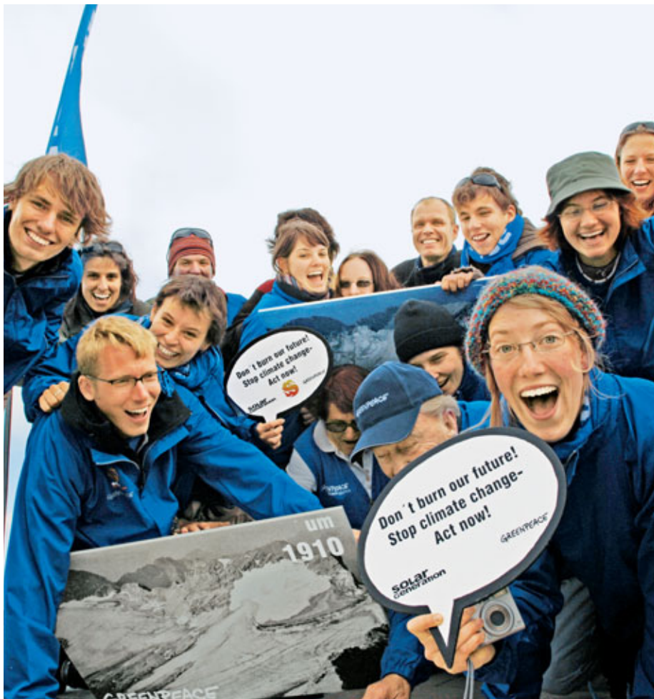
„Klimagipfel“ wörtlich genommen: Auf dem höchsten Gipfel Deutschlands, der Zugspitze, demonstrieren Greenpeace-Jugendliche im September 2005 für mehr Klimaschutz. Durch wärmere Temperaturen drohen die Gletschergebiete der Alpen, darunter auch das der Zugspitze, in wenigen Jahrzehnten wegzuschmelzen.