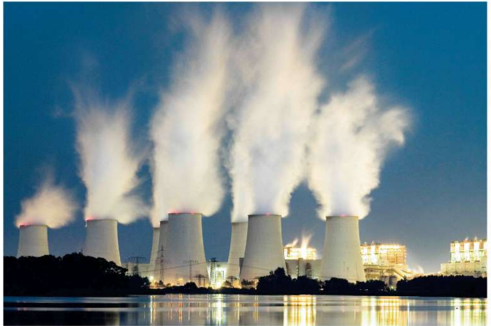
Bald „sauber“? Vattenfalls Braunkohlekraftwerk in Jämschwalde stößt jährlich 25 Mio. Tonnen CO 2 aus.

dass die CO 2 -Abscheidetechnik per Gerichtsbeschluss nicht als „CO 2 -frei“ bezeichnet werden darf? Das CO 2 kann nämlich gar nicht vollständig abgeschieden werden, und es entweichen noch erhebliche Mengen in die Atmosphäre.