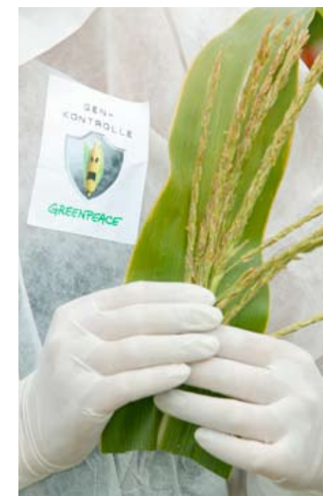
Pflanzenprobe von Gen-Mais der Firma Monsanto.

baut. Trotzdem war eine Verunreinigung durch einen schon 2001 abgeschlossenen Versuchsanbau mit Gen-Reis verursacht worden. Die USA hatten den betroffenen Langkorn-Reis inzwischen in mindestens 30 Länder exportiert. In Deutschland wurde er bei Aldi Nord, Edeka, Kaufland und anderen Handelsketten gefunden. Die Supermärkte nahmen daraufhin die betroffenen Produkte aus ihren Regalen. Wichtige Importeure wie die EU und die Philippinen erließen ein Importverbot von US-Reis. Der Skandal löste die größte Handelskrise in der Geschichte der US-Reisindustrie aus: 63 Prozent aller US-Reishändler waren betroffen, Reisbauern, Erntearbeiter, verarbeitende Unternehmen, Müller und Einzelhändler unwissentlich in ihn verstrickt. Der gesamte Schaden wurde auf 1,2 Milliarden US-Dollar geschätzt. Verunreinigun-