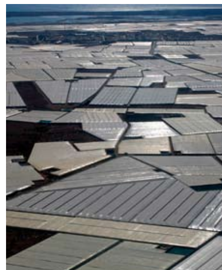
Plastikfolien-Gewächshäuser in Almeria