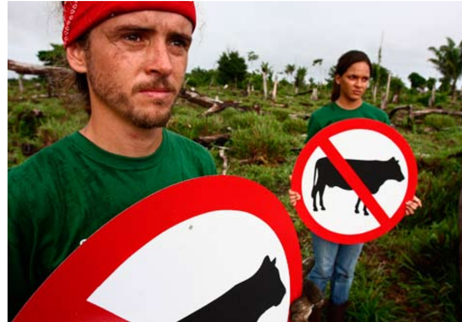
Greenpeace protestiert in Brasilien gegen die Abholzung von Urwald für Rinder-Weideland.