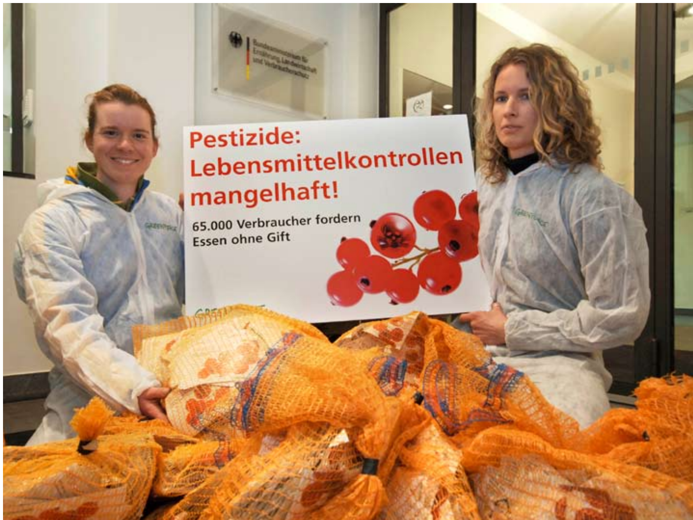
Der ehemalige Verbraucherminister Seehofer bekommt 65.000 Protestkarten, weil seine mangelhafte Kontrolle Verbraucher schlecht vor Pestiziden in Lebensmitteln schützt.

Die Kette von Skandalen reißt nicht ab. Im Preiskampf um die billigsten Nahrungsmittel bieten die Supermärkte Masse statt Qualität: Im Einkaufskorb landet pestizidbelastetes Obst und Gemüse sowie Fleisch, das zu über 90 Prozent aus der Massentierhaltung stammt. Auch die Gentechnik ist nicht vom Tisch: Über die Futtermittel bahnt sie sich den Weg zum Verbraucher.