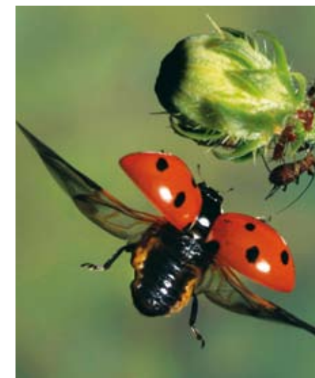
Marienkäfer auf Blattlausjagd

müssen allein die Wasserwerke ausgeben, um die Giffracht aus dem Trinkwasser zu entfernen.