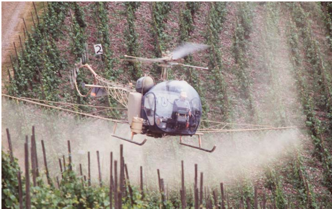
Auch über deutschen Weinbergen werden Pestizide aus der Luft versprüht.

Vitamine, Ballast- und Mineralstoffe machen Obst, Gemüse und Getreide zu besonders gesunden Lebensmitteln. Doch durch die intensive konventionelle Landwirtschaft landen unerwünschte Substanzen auf unserem Teller, die uns krank machen können. Vor allem Pestizide gefährden unsere Gesundheit – und ganz besonders die der Arbeiter auf Äckern und Plantagen.