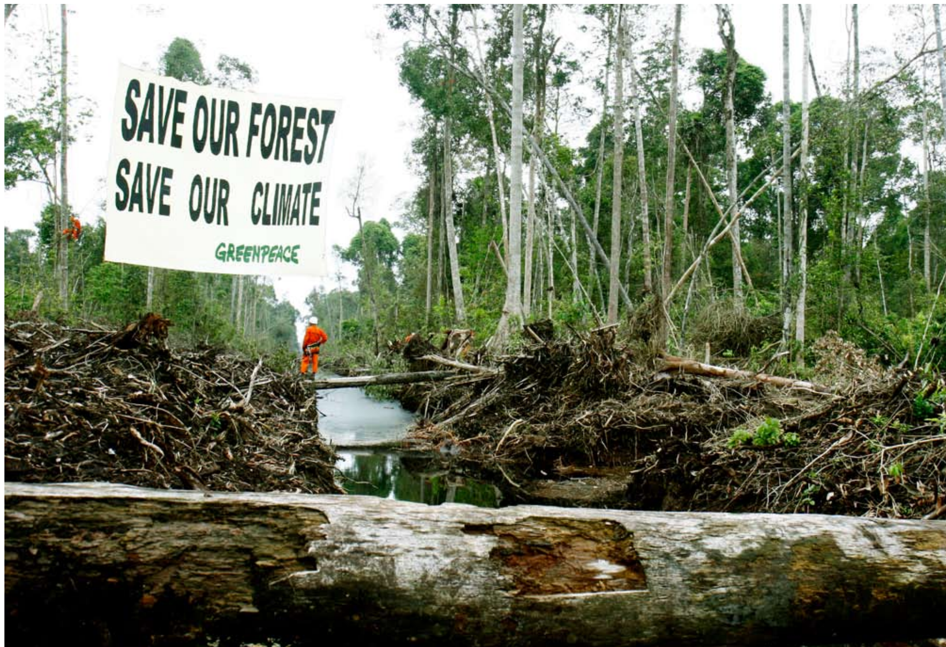
Greenpeace protestiert im indonesischen Regenwald gegen die Zerstörung der Wälder für Ölpalm-Plantagen.

sowie 65 Prozent an Stickoxiden. Allein Japan und Indien zeigen, dass es bei anderen Gewohnheiten und kulturellem Hintergrund auch anders geht. Weniger oder gar kein Fleisch zu essen, wäre ein Mittel gegen die Erderwärmung. Die Tierhaltung ist hauptverantwortlich für den weltweit steigenden Wasserverbrauch, vor allem durch die Bewässerung und Beregnung von Futtermittelpflanzen. Während der Wasserbedarf von weidenden Tieren zu einem Großteil über das Futter direkt gedeckt wird, enthalten Ge-