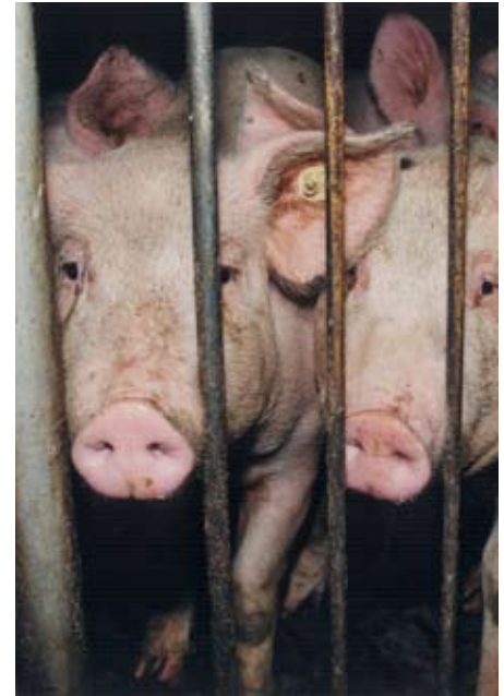
So leben Schweine in der Massentierhaltung.

Die Globalisierung hat weltweit erhebliche Folgen für die Landwirtschaft. Da der Transport von Agrargütern relativ günstig ist, wird ein immer größerer Teil der Welternte international gehandelt. Beispielsweise importiert die EU nicht nur Obst, das hierzulande aus klimatischen Gründen nicht wächst, sondern immer mehr auch eiweißreiche Futtermittel wie Soja oder Maiskleber. Mit diesen Futtermittelimporten werden in Europa Fleisch und Milch im Überschuss produziert, um diese dann nach Russland, Asien und in südliche Länder zu exportieren.