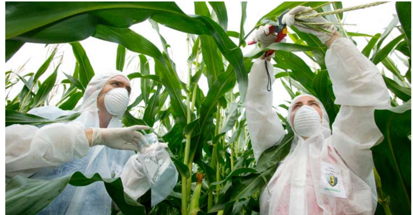
Seit langem ist Greenpeace gegen den in Europa bisher erlaubten Gen-Mais der Firma Monsanto aktiv - mit Erfolg: Im April 2009 wird die Aussaat von Mon810 in Deutschland verboten.

zählt. So ist Deutschland der billigste Lebensmittelmarkt in Westeuropa. Verbraucher- und Umweltschutz gelten in diesem Geschäft nicht viel. Greenpeace hat es jedoch mit seinem Programm „Stopp Gift im Essen“ geschafft, dass alle großen deutschen Supermarktketten neue und strenge Standards für die Pestizidbelastungen festgelegt haben, die durchweg schärfer sind als die gesetzlichen Grenzwerte. Alle Ketten haben inzwischen Programme zur Senkung der Pestizidbelastungen gestartet: Intensive Kontrollen, Auswahl der Lieferanten, Vertragsanbau, Schwarze Listen für besonders gefährliche Pestizide gehören zu den neuen Instrumenten. Das zeigt Wirkung – bei vielen Produkten sinken die Belastungen endlich deutlich.