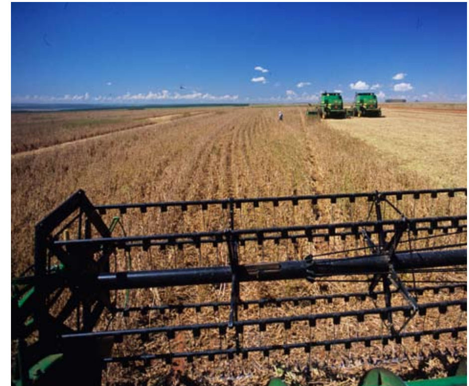
Im brasilianischen Mato Grosso werden jährlich 5,5 Millionen Hektar Land als Soja-Anbaufläche genutzt.

Lachgas ist ein besonders langlebiges Klimagas, das sich im Schnitt erst nach 114 Jahren abbaut und 300-fach so klimaschädlich ist wie CO 2 . Vor allem beim Einsatz von Stickstoffdünger und Dung aus der Tierhaltung wird es freigesetzt. In den letzten 50 Jahren hat sich der Mineralstickstoffeinsatz weltweit verachtfacht, proportional dazu ist die Lachgas-Kon-