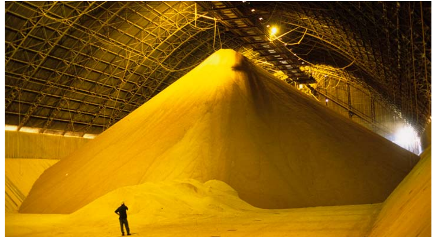
Allein in Brasilien werden jährlich rund 60 Millionen Tonnen Soja produziert, die in Silos gelagert und dort für den Export auf Schiffe verladen werden.

Landwirtschaft betrifft uns alle. Denn es geht um unsere existenziellen Grundlagen: Erde, Wasser, Luft und unsere Nahrung. Bekannt ist das schon lange. Inzwischen haben wir aber auch reichlich Erfahrungen mit den Problemen der heutigen Landwirtschaft gemacht. Sie ist sowohl Opfer – leidet also unter den Umweltbelastungen – als auch Verursacher von Umweltverschmutzungen.