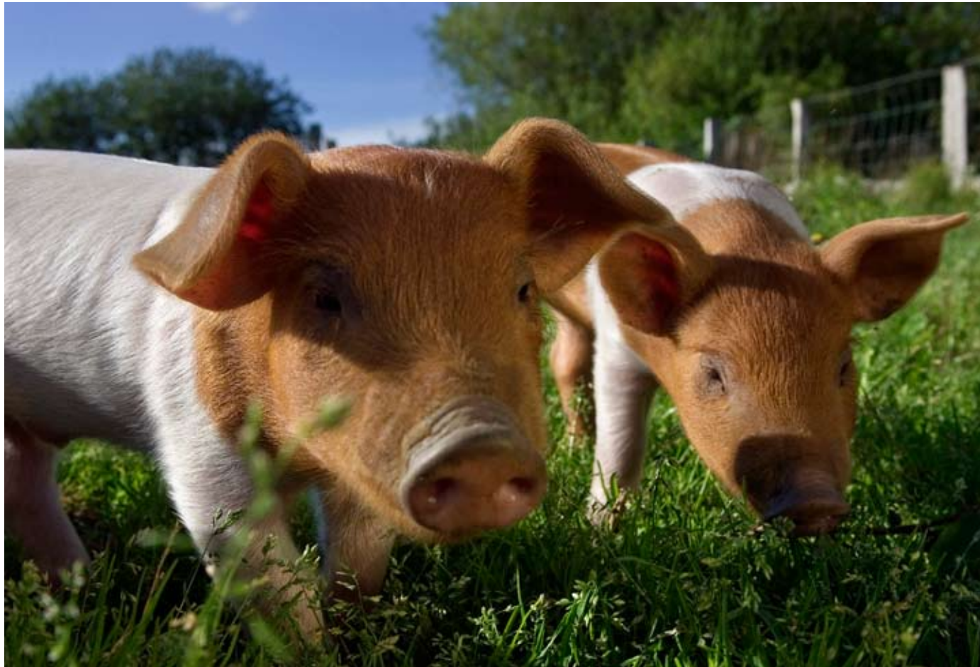
Der schleswig-holsteinische Tierpark Arche Warder beherbergt circa 1.100 Tiere alter Haus- und Nutztierassen.

Die industrielle Landwirtschaft ist für gravierende Umweltprobleme verantwortlich: Pestizide finden sich im Grundwasser wieder, der Anbau von Monokulturen verschlingt enorme Mengen an Wasser und zerstört in kurzer Zeit fruchtbare Böden.