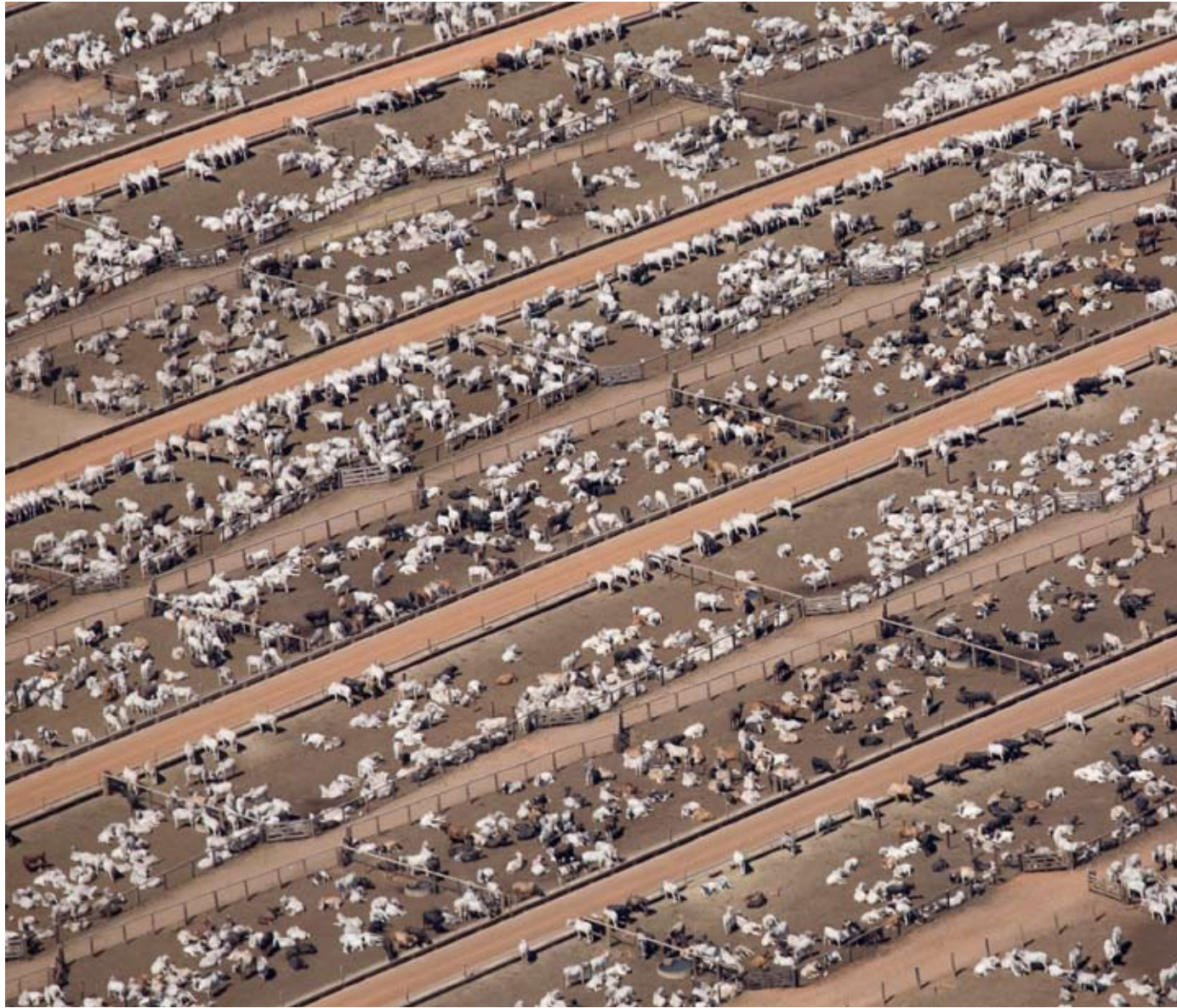
Viehzeit beansprucht 70 Prozent der landwirtschaftlich genutzten Fläche in Brasilien.

Steigende Durchschnittstemperaturen, Extremwetter, Stürme, Überschwemmungen und lange Trockenzeiten: Der Klimawandel ist bereits Realität. Die Landwirtschaft ist dabei Opfer und Täter.