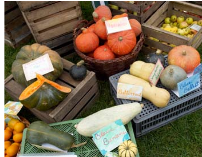
Tiere, Gemüse und Produkte aus Eigenerzeugung können auf der Jahresauktion in Warder ersteigert werden.

Immer mehr Menschen auf unserem Globus verzehren immer mehr Lebensmittel. Gleichzeitig nehmen Umwelt- und Klimaprobleme weltweit zu, viele Pflanzen können den immer neu entstehenden