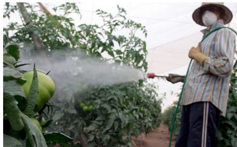
Kaum geschützt: Arbeiter an der spanischen Küste beim Spritzen der Pestizide

Besonders gefährdet sind Arbeiter in der Landwirtschaft. Gerade in Entwicklungsländern, aber auch in Südeuropa fehlt es oft am notwendigen Arbeitsschutz. So kommt es durch den Einsatz von Spritzmitteln nach Angaben der Weltgesundheitsorganisation zu jährlich weltweit bis zu 200.000 Toten durch Vergiftungen. Die Agrargifte sind auch für den starken Rückgang der Artenvielfalt verantwortlich. Sie belasten das Grundwasser, Flüsse und Seen. Zig Millionen Euro jährlich