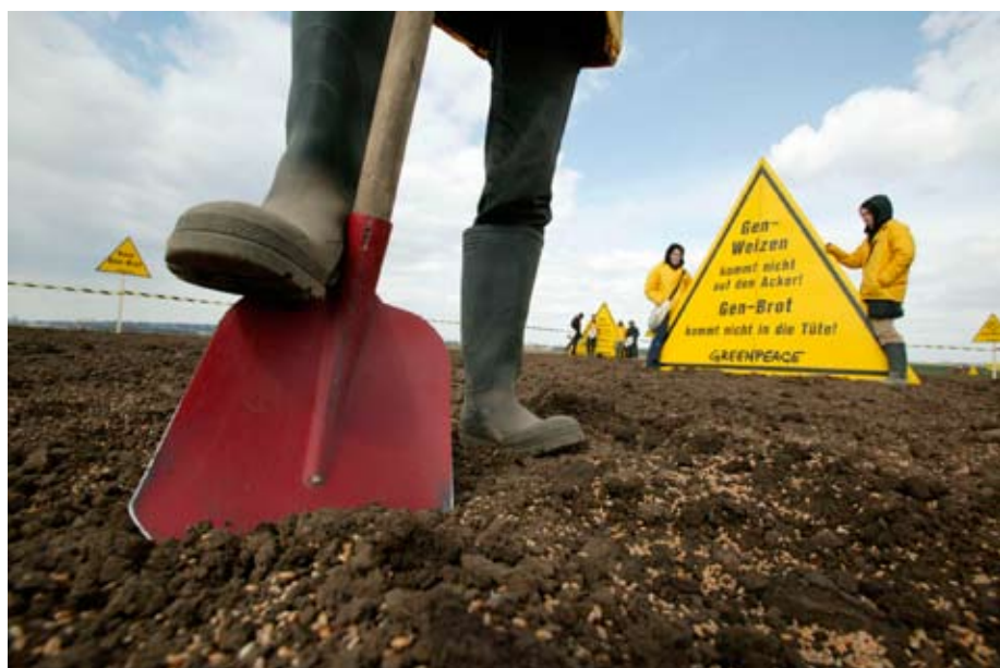
Gegen die geplante Freisetzung von Gen-Weizen durch Syngenta säen Greenpeacer auf der Versuchsfläche Bio-Weizen aus.

Die Saatgut- und Chemiekonzerne, allen voran Monsanto, Bayer, Dupont, Syngenta und BASF, richten mit Pestiziden große ökologische Schäden an. Gleichzeitig fahren sie satte Gewinne ein. Seit Jahren versuchen sie nun, uns auch mit der Gentechnik zu beglücken. Ihre Versprechen: gesündere Nahrungsmittel, höherer Ertrag durch Gen-Pflanzen und geringerer Einsatz von Pestiziden. Ihr Ziel dabei ist aber, die gesamte Lebensmittelkette, vom Saatgut bis zum Essen, in die Hand zu bekommen. Den Verbrauchern sollen riskante Nahrungsmittel schmackhaft gemacht werden, Landwirte werden in eine stärkere Abhängigkeit von den Konzernen getrieben.