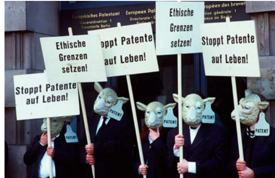
Greenpeace-Protest gegen fragwürdige Patentvergabe beim Europäischen Patentamt.

Mit Patenten versucht sich die Industrie, ein Monopol über die landwirtschaftliche Produktion und Ernährung zu verschaffen. Patente im Bereich Landwirtschaft können exklusive Rechte über Saatgut, Ernte bis hin zu den Lebensmitteln beinhalten. Die Konzerne diktieren dann, wer was zu welchen Bedingungen und Preisen anbauen und verkaufen darf: vom Weizen bis zum Brot, vom Mais bis zum Popcorn.