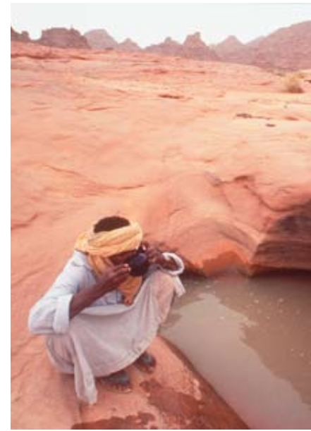
Die Wasserressourcen werden in Nordafrika knapp.

In Nordafrika werden die Wasserressourcen bereits fast vollständig – zu 95 Prozent – genutzt. Und die Nachfrage steigt bis 2025 noch weiter an. Daher werden massive Wasserzuflüsse aus anderen Regionen nötig sein. Auch in einigen Ländern Asiens nimmt der Wasserverbrauch in