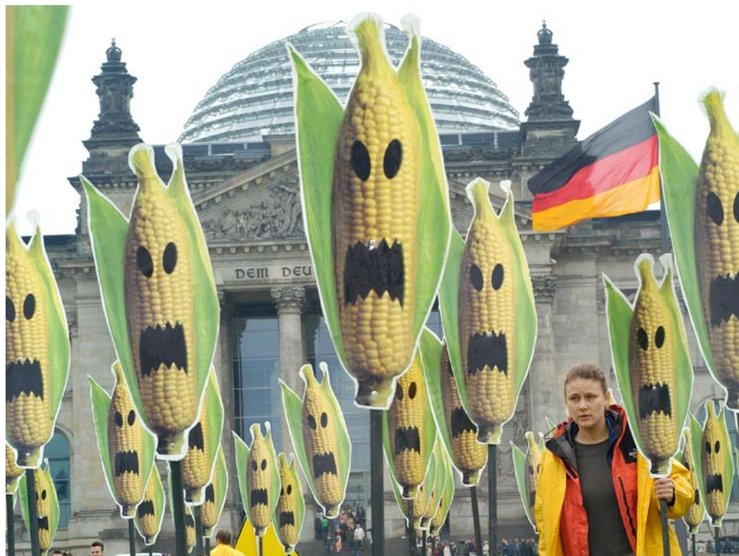
Greenpeace-Protest in Berlin gegen die unkontrollier te Ausbreitung von Gen-Pflanzen durch falsche EU-Politik.

wirte, ungeahnte Nebenwirkungen und Resistenzen bei Schädlingen sind nur einige durch Gen-Pflanzen verursachte Probleme. Meist werden die Gene mit Schrotschuss-Verfahren in die Pflanzenzellen geschossen. Die Gentechniker können weder steuern, wo das Gen im neuen Organismus landet, noch zu welchen Wechselwirkungen es mit anderen Genen und Proteinen kommt – ein Blindflug. Mit der wissenschaftlichen Erkenntnis, der Mensch besitze nur etwa 30.000 statt der zunächst vermuteten 100.000 Gene, wurde die Grundannahme der Gentechnik widerlegt, ein Gen habe nur eine Wirkung. Die Wechselwirkungen der Gene untereinander und mit Proteinen sind komplexer als angenommen. So wundert es nicht, dass Gen-Pflanzen ungewollte und nicht kalkulierbare Eigenschaften entwickeln. Langzeitstudien zu Gen-Pflanzen gibt es bisher nur wenige. Wissenschaftler stellten aber bei Fütterungsversuchen fest, dass zum Beispiel das Immunsystem der mit Gen-Mais gefütterten Mäuse geschwächt wurde. Trotzdem wird dieser Gen-Mais des Herstellers Monsanto in Europa seit 1998 als Lebens- und Futtermittel angebaut. In Europa haben Länder wie Frankreich, Österreich, Ungarn, Schweiz, Griechenland, Luxemburg und im April 2009 auch Deutschland den Anbau des