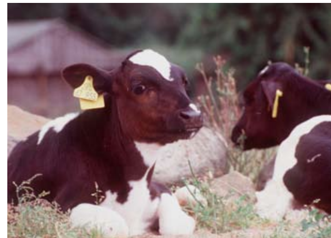
Das schwarzbunte Niederungsrind zählt zu den vom Aussterben bedrohten Haustierrassen.