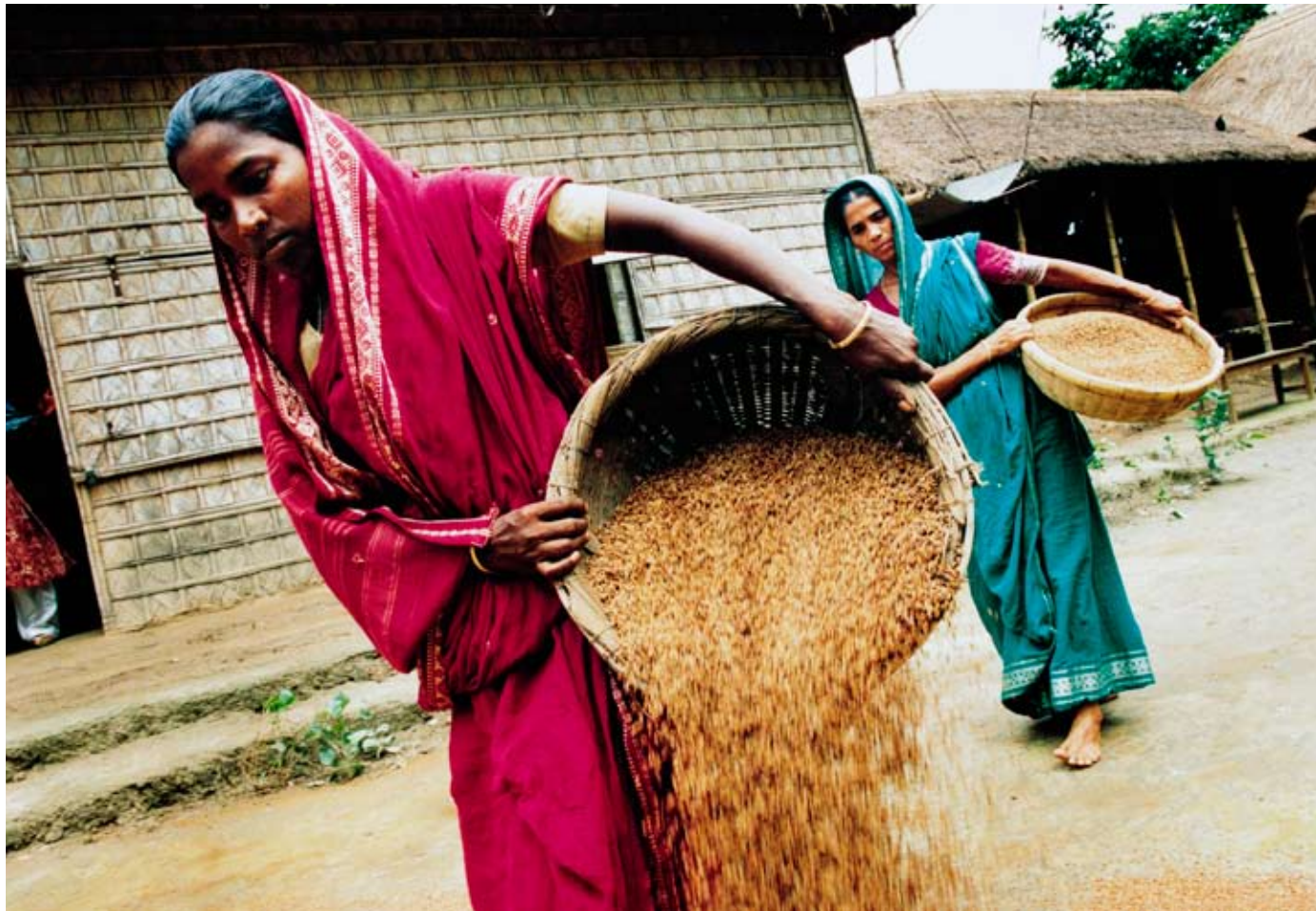
In Bangladesch betreiben Frauen nachhaltige Landwirtschaft, z. B. trocknen sie ihr Saatgut in der Sonne.

Hunger und Armut sind in erster Linie ein politisches und soziales Problem: Über 880 Millionen Menschen hungern weltweit, obwohl ausreichend Lebensmittel produziert werden. Versucht wird dies durch unfaire Handelsbedingungen, Kriege, politische Strukturen und fehlenden Zugang zu Ressourcen wie Land, Wasser, Saatgut oder finanzielle Mittel. Allein mehr Lebensmittel zu produzieren, kann den Hunger also nicht besiegen. Auch Klimawandel und Wetterextreme beeinflussen die Landwirtschaft und damit die weltweite Lebensmittelproduktion. Betroffen sind in erster Linie Kleinbauern und Konsumenten in den Ländern des Südens.