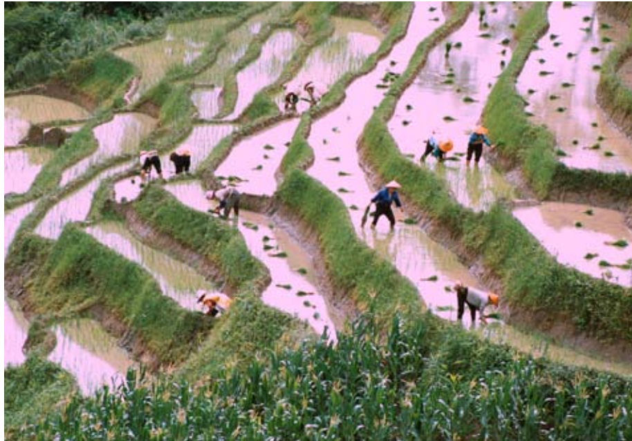
In China wird Reis auf Terrassen angebaut, um auch Berghänge zu nutzen.

Nutzbare Flächen für Acker- und Grünland sind aus klimatischen und geologischen Gründen begrenzt. Weltweit wird ein Drittel der Landfläche, circa 5 Milliarden Hektar, landwirtschaftlich genutzt: 1,5 Milliarden Hektar davon als Äcker, weitere 3,5 Milliarden Hektar als Wiesen und Weiden.