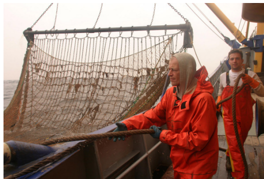
Problem: zerstörerische Fischereimethoden

le, kommt es zudem immer wieder dazu, dass die Gesetze der GFP gleich ganz ignoriert werden. Die polnischen Kutterkapitäne überzogen in den vergangenen Jahren ihre Dorschquote um bis zu 40 Prozent – die notwendigen Kontrollen um dies zu verhindern fehlten. Doch u. a. durch intensivere Kontrollen und der dadurch eingedämmten illegalen Fischerei wuchsen die Dorschbestände der östlichen Ostsee wieder an.