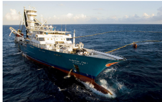
Abb.1 : Albacora Tres, das größte Thunfischfangschiff der Welt

OPAGAC ist das größte Handelsunternehmen der spanischen Thunfischfänger, der Konservenhersteller und Händler. Das Unternehmen betreibt mindestens 13 große Thunfischfangschiffe mit einer Gesamtlänge von über einem Kilometer. Zu den OPAGAC-Mitgliedern gehören die Thunfischgiganten Albacora S.A. , Calvopesca und Fangschiffe der Firma Conservas Garavilla SA .