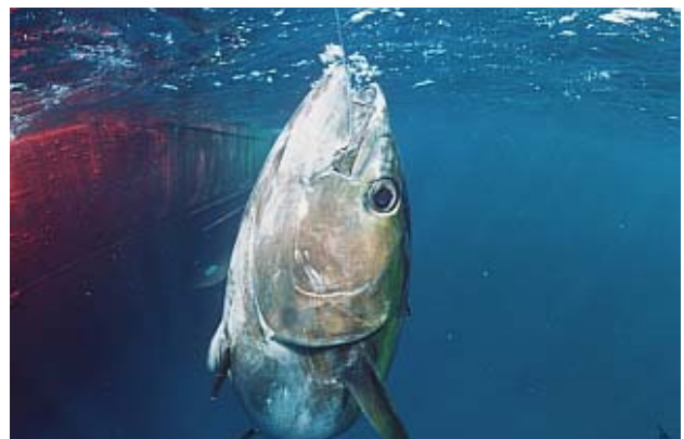
Big-Eye-Tunfisch an einer Langleine im Atlantik

Weitere Informationen zur Fischerei finden Sie u.a. in den "Greenpeace-Prinzipien für eine ökologische Fischerei", in "Piratenfischer auf der Jagd nach Tunfisch" und in der Broschüre "Fisch & Facts".