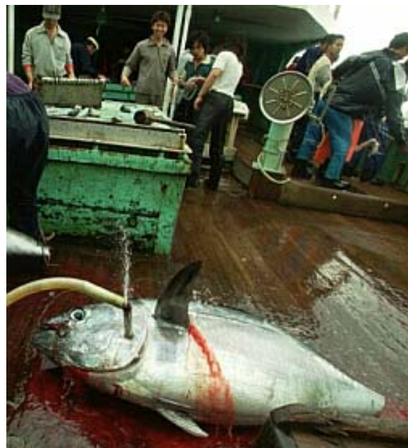
Illegal im Atlantik gefangener Tunfisch, auf hoher See umgeladen auf ein Kühlschiff

Die langjährige und erfolgreiche Kampagne gegen Treibnetze war ein wichtiger Schritt. Der größte Teil des in Deutschland verkauften Tunfisches in Dosen wird aus Südost-Asien importiert. Dort befinden sich die Verarbeitungszentren, wo Tunfische von Fischereischiffen aus verschiedenen Ländern, aus unterschiedlichsten Fanggebieten und Fangmethoden verarbeitet werden. Auch wird Tunfisch auf hoher See auf andere Schiffe umgeladen. Ohne unabhängige Kontrolleure an Bord der Schiffe ist nicht wirklich nachweisbar, welche Herkunft der Tunfisch wirklich hat. Und es reicht nicht aus, Tunfischdosen nur nach "Delfin-Freundlichkeit" auszuzeichnen.