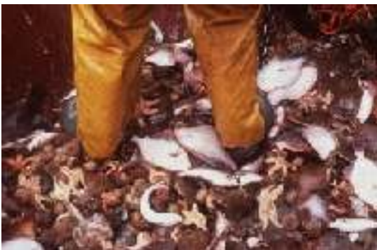
Kleine Fische, Seesterne und Krebse werden als Beifang in der Nordsee mitgefangen.

Hochgerüstete Fangflotten machen Jagd auf immer weniger Fisch: Seit 1970 hat sich die weltweite Kapazität der Fischereiflotte verdoppelt. Obwohl von den 3,5 Millionen weltweit eingesetzten Fischereischiffen nur etwa ein Prozent industrielle Schiffe sind, schöpfen diese 50-60 Prozent der Bestände ab.