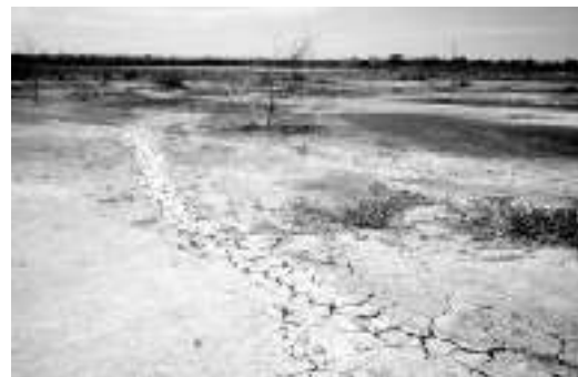
Ausgetrocknete Fläche einer ehemaligen Shrimpfarm in Ecuador

Oft wird die Aquakultur als mögliche Lösung der Fischereikrise erwähnt. Über ein Viertel der globalen Fischerei-Erträge stammt heute schon aus Käfigen und Teichen. Die FAO erwartet, dass im Jahre 2030 mehr als die Hälfte aller Speisefische aus Zuchtanlagen kommen. Doch die Probleme der Aquakultur sind erheblich: Neben der Mangroven-Abholzung für Garnelenteiche in den Tropen sind dies vor allem die Abwässer und der Einsatz