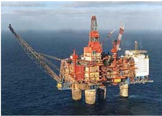
Abbildung 2: Ölplattform

Von den circa 900.000 Tonnen auf See genutzter Chemikalien wurden 253.000 Tonnen ins Meer geleitet, was über einem Viertel entspricht. Davon wurden knapp 87% von der OSPAR als für die Umwelt mit keinem bis kleinem Risiko eingestuft 4 . 2007 wurden dem Meer 70 Kilo LCPA-Substanzen zugeführt. Dabei handelte es sich um Blei, das als Schmiermittel für Rohrverbindungen benutzt wurde.