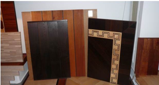
Parkett aus den Urwäldern Kongos, wie man es überall in Deutschland kaufen kann

Da sich die deutsche Regierung nicht zu einem Urwaldschutzgesetz durchringen konnte, ist es nach wie vor möglich, Fenster, Türen oder Parkett aus Urwaldzerstörung und zweifelhaften Quellen zu handeln. Holz aus der DR Kongo wird nicht nur direkt durch deutsche Sägewerke und Parketthersteller verarbeitet, sondern findet seinen Weg auf den deutschen Markt auch über Italien und anderen europäische Länder.