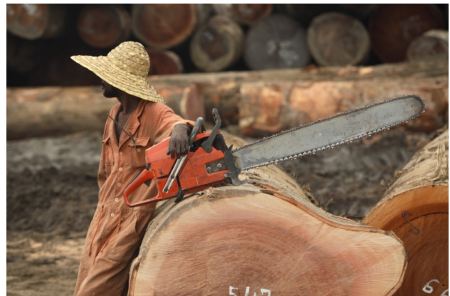
Holzlagerplatz in der Region Bandundu

werden sind zum Teil breiter als Europas Autobahnen. Mit dem Zugang kommen die Wilderer, die die großen Säugetiere für den Handel mit Bushmeat (Fleisch wild lebender Tiere) und Elfenbein töten. Ist der Wald erst einmal durch Straßen erschlossen, ist das Gebiet auch anfällig für landwirtschaftliche Rodungen.